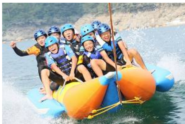
静水のさめうら湖に波が立つ?? みんなで息を合わせて乗り越えよう!!!