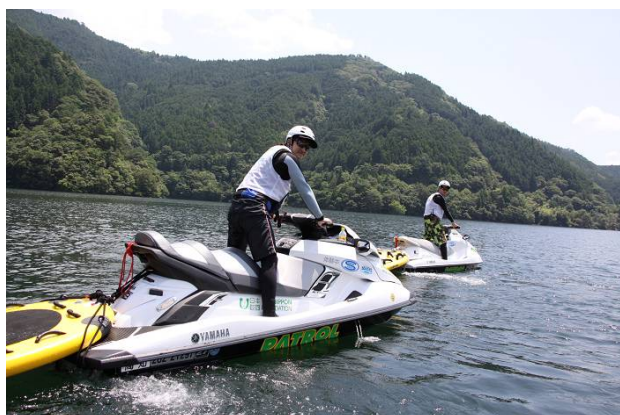
スイムはちょっと苦手…という方もご安心ください！ 水上警備隊がサポートします(^)