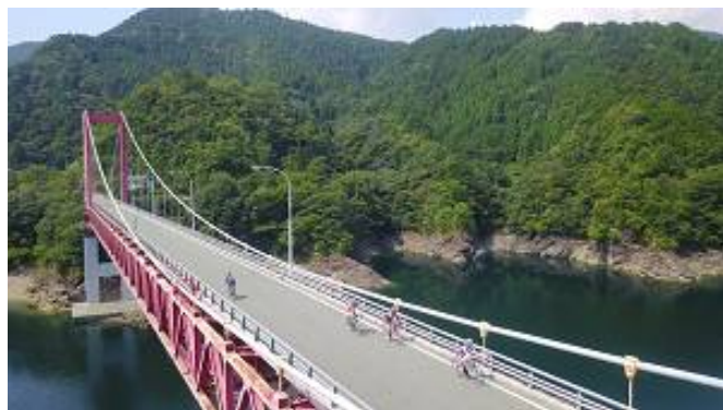
瀬戸大橋のモデルとして建設された 上吉野川橋を渡ります。(予定)