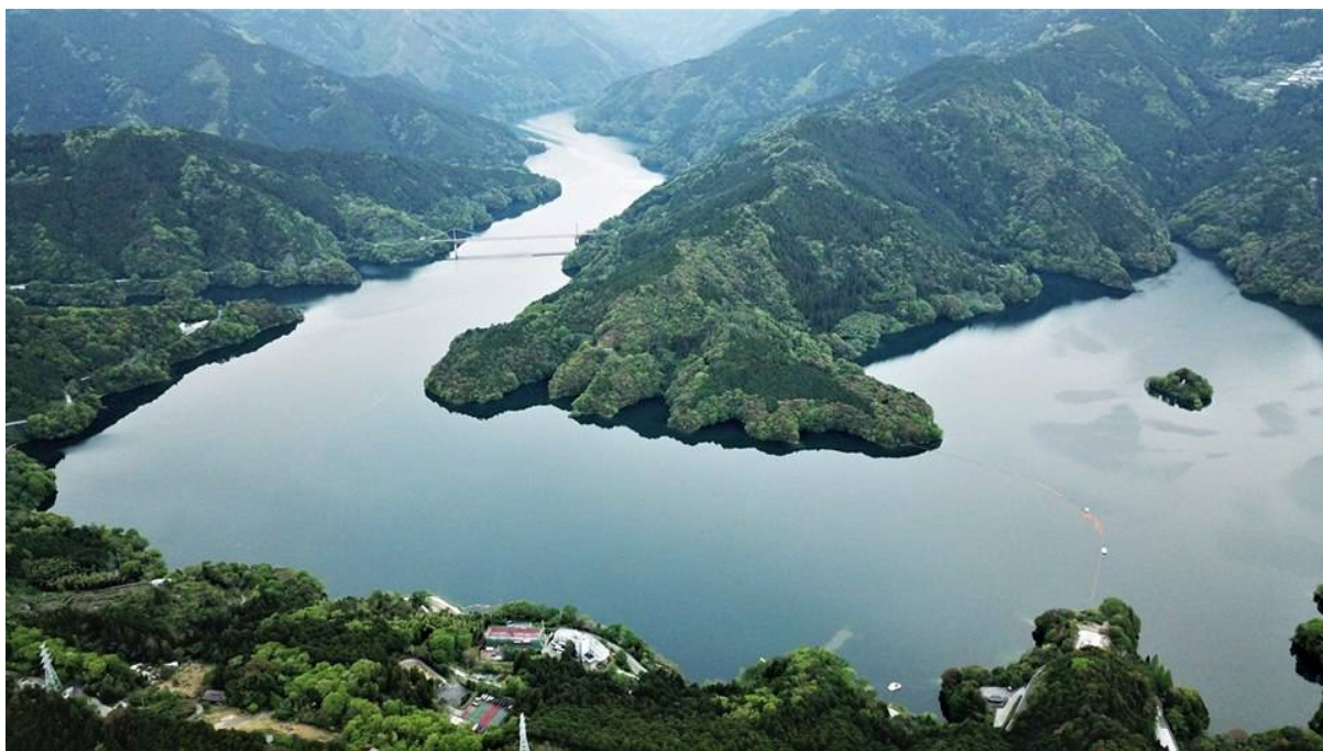
（会場周辺参考画像）

Swim（さめうら湖）→Bike（早明浦ダム湖畔添い）→Run（早明浦ダム湖畔添い） ※コース図詳細は追ってお知らせします。道路状況等により変更される場合があります。